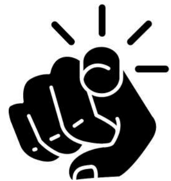
... You ?