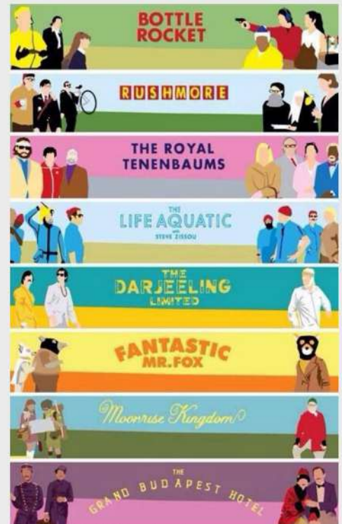
List of Wes Anderson movies

Suddenly one of Gustave's lovers dies mysteriously and he becomes a prime suspect, while also receiving a priceless painting. Throughout the movie he tries to prove his innocence with the help of Zero. The movie has all his special techniques, like a vivid colour palette with a good balance between pink and orange corresponding to the mood and timeline in the movie. It has some action, romance and comedy with an Anderson twist, so it's not surprising how popular it is.