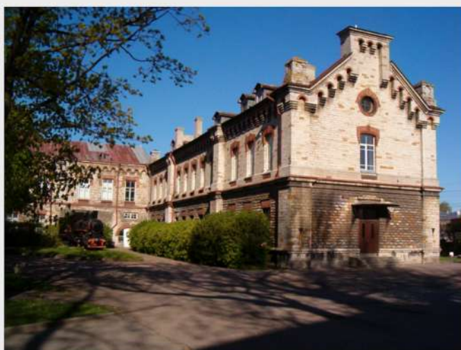
European School of Tallinn (Estonia)

Joyeux Noël et Bonne Année ! Frohe Weihnachten und ein glückliches Neues Jahr! Merry Christmas and Happy New Year!