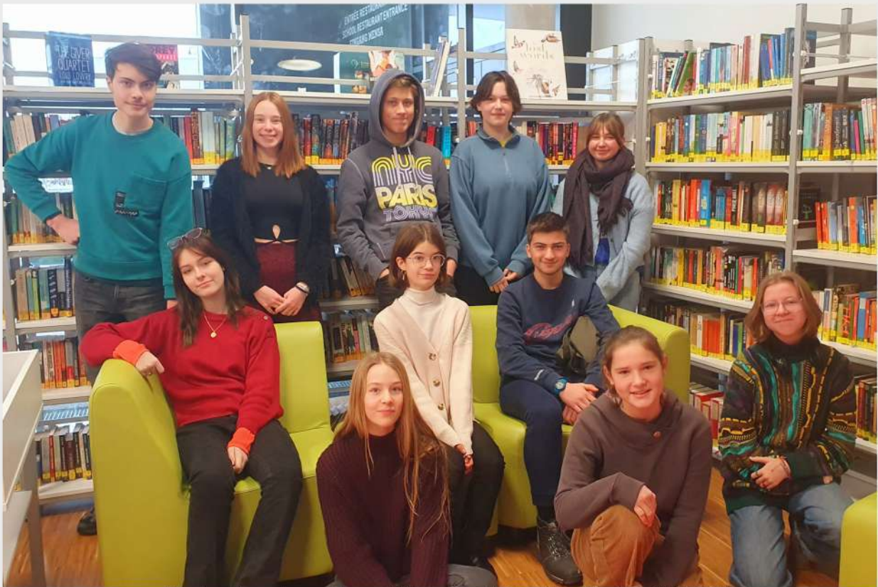
Photo of most members of the project.